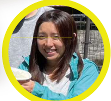
龍山 × 芸術プロジェクト のパイオニア