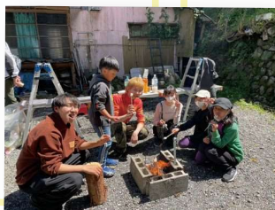
若手たっぷろとたっぷろジュニア