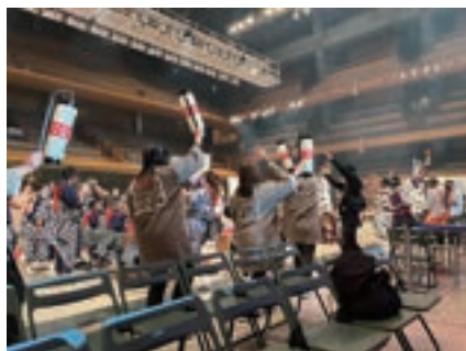
三島伝統の祭囃子 しゃぎりの実演