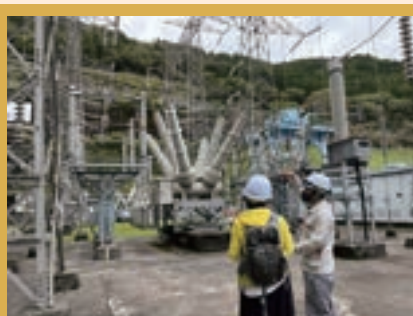
秋葉ダム見学 インフラ×アートという視点でのダム見学はとても興味深かったです。