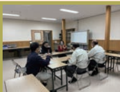
交流会（協働センター） 行政の方に本事業の生の声を共有する良い機会となりました。