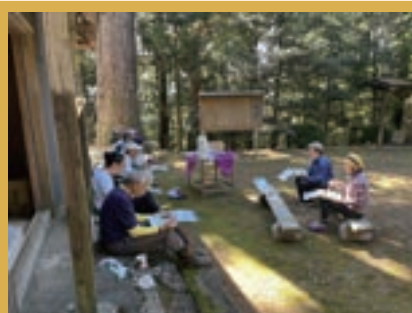
白山神社のお掃除 お掃除に参加していただき、瀬尻地域の皆さんと交流しました。