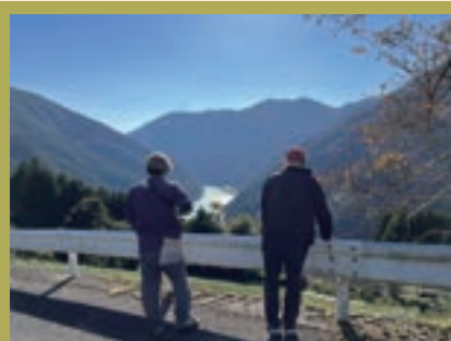
民話を絡めた地域巡り 私も知らなかったお話をたくさん伺いました。

12月に実施するイベント「龍山、ぼちゃん」は昨年度来てくださった芸術家の方々のご協力のもと開催されますが、今年度来てくださった方々とも、今後何かやれたらいいなと思っています！